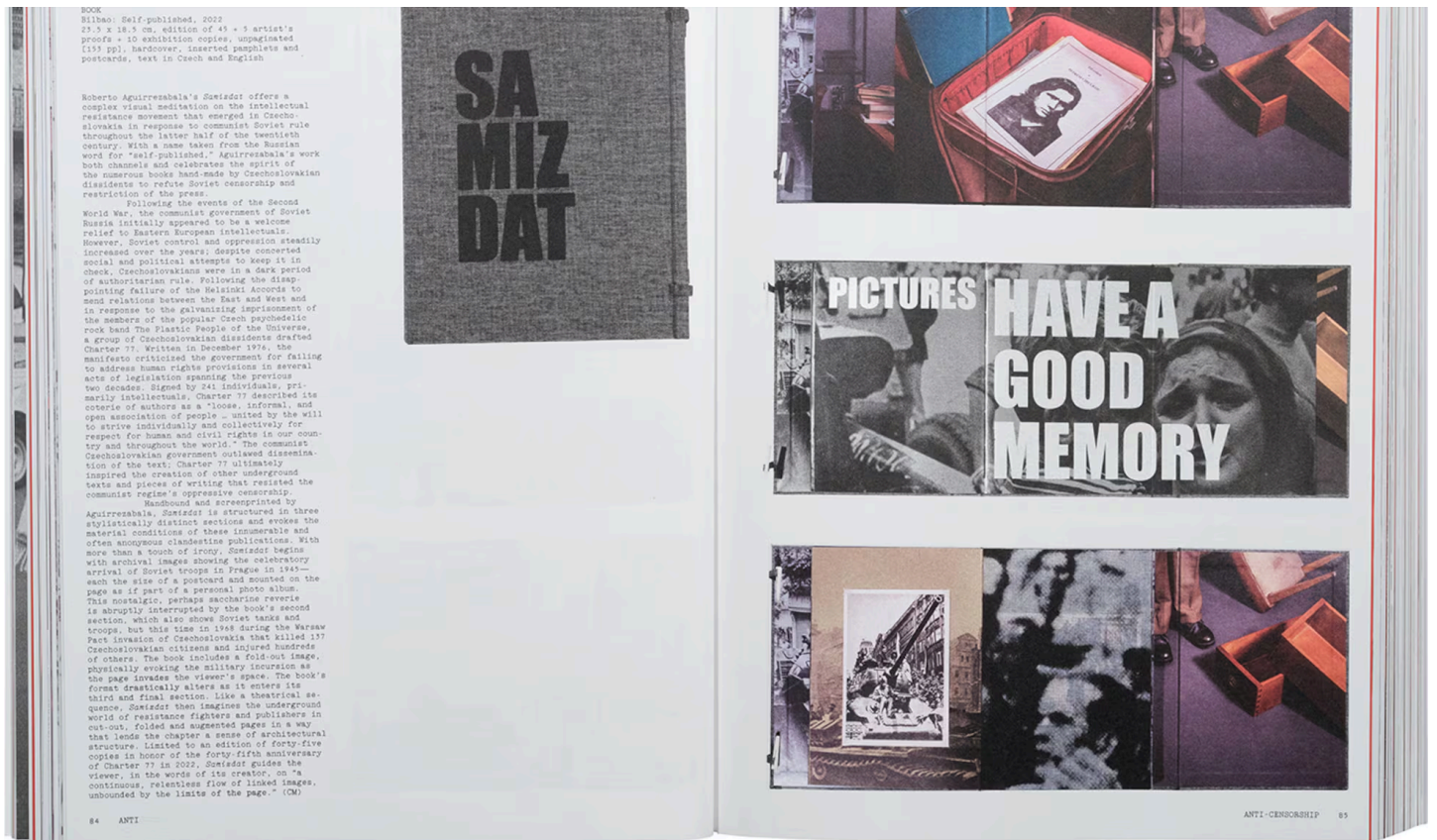
Imagen del interior del fotolibro 'Flashpoint!' que muestra 'Samizdat' (Autopublicado, 2022), de Roberto Aguirrezabala.

Las consecuencias de la censura se manifiestan a través de Negatives , del chino Xu Yong (Hong Kong: New Century Pres, 2014), testigo de la Matanza de Tiananmen . El fotolibro se publicó 25 años después de aquellas protestas brutalmente sofocadas. Compuesto por negativos de color, ofrece una versión tan onírica como imparcial de lo ocurrido, que el lector tendrá que 'revelar' o descodificar, haciendo uso de la de la función de invertir el efecto del color de la cámara de un teléfono inteligente o de una tableta. El libro tiene prohibida la distribución en China.