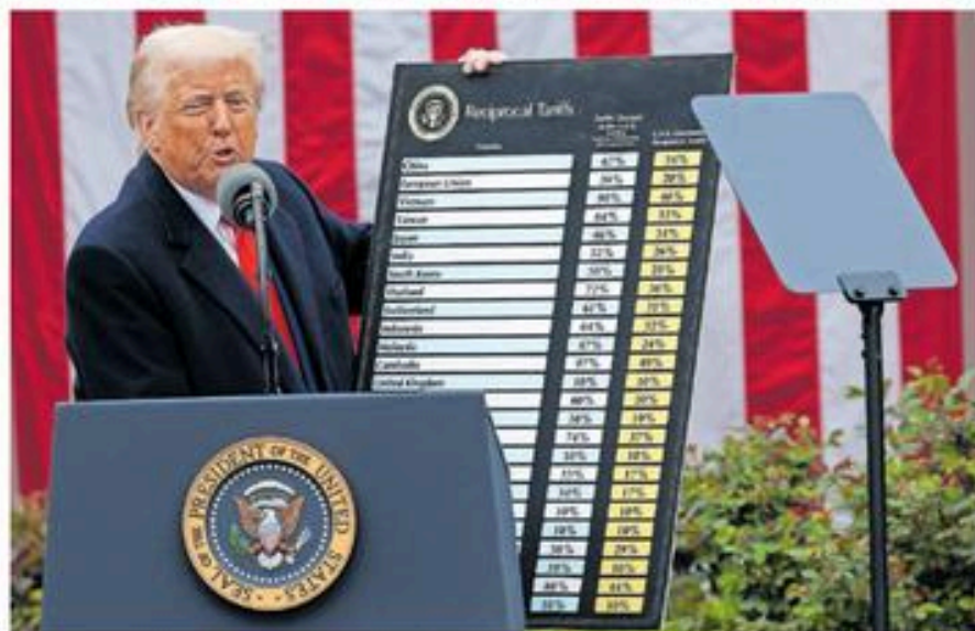
Donald Trump mostraba ayer una lista con los aranceles para cada país en el acto en los jardines de la Casa Blanca.

ciar un discurso de resentimiento y ánimo de revancha, apoyado en falsedades sobre las trabas que ponen a EE UU otros países. Los aranceles más altos en un siglo oscurecen el horizonte de la economía. —P2 Y 3